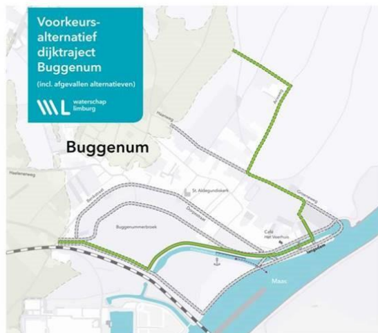
Figuur 3: Alternatieven dijktraject Buggenum (voorkeursalternatief is groen opgenomen)